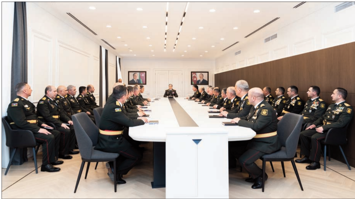
Əvvəli 1-ci səhifədə.

Nazir vurğulayıb ki, bu gün dövlət başçısının ali diqqət və qayğısının, tələb və göstərişlərinin nəticəsi olaraq, Daxili Qoşunlar qarşısına qoyulan istənilən döyüş tapşırığını yüksək keyfiyyətlə yerinə yetirməyə qadirdir. Müzəffər Ali Baş Komandanın əmri ilə düşmən həmlələrinə qarşı keçirilən "Dəmir yumruq" əks-hücum əməliyyatlarında hərbi qulluqçularımız bunu bir daha təsdiq etdilər.