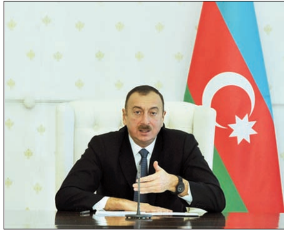
Prezident İlham Əliyevin giriş nitqindən:

Yanvarın 9-da Azərbaycan Respublikasının Prezidenti İlham Əliyevin sədrliyi ilə Nazirlər Kabinetinin 2013-cü ilin sosial-iqtisadi inkişafının yekunlarına və 2014-cü ildə qarşıda duran vəzifələrə həsr olunmuş iclası keçirilmişdir.