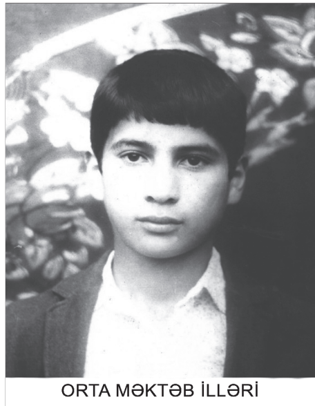
ORTA MƏKTƏB İLLƏRİ

“...Məhərrəm olduqca tərbiyəli şagird idi. V-VIII siniflərdə oxuyarkən sinif rəhbəri olmuşam. Elmə marağı yüksək olduğundan, dərs əlaqəsi idi. Riyaziyyata marağı çox idi. Yüksək əlaqi keyfiyyətlə malik olmaqla yanaşı, ictimai işlərdə liderlik etməyi