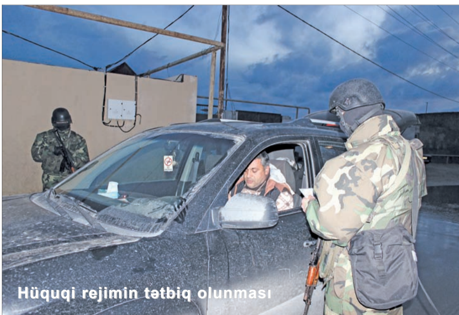
Hüquqi rejimin tətbiq olunması

"Eurovision-2012" mahnı müsabiqəsi, 2012-ci ilin sentyabr-oktyabr aylarında 17 yaşına qədər qadınlar arasında futbol üzrə Dünya çempionatı, 2015-ci il iyunun 13-dən 15-dək Bədii gimnastika üzrə Avropa çempionatı, 2015-ci il iyunun 12-dən 28-dək I Avropa Oyunları, 2016-cı il sentyabrın 16-dən 23-dək gənclər arasında Atıcılıq üzrə Dünya kubokunun mərhələ yarışları, 2016-cı il iyunun 17-dən 19-dək "Formula-1 Avropa Qran-Pri", 2017-ci il iyunun 23-dən 25-dək isə "Formula-1 Azərbaycan Qran-Pri" yarışları, 2017-ci il mayın 12-dən 22-dək IV İslam Həmrəyliyi Oyunları zamanı təhlükəsizlik tədbirləri yüksək səviyyədə təşkil edilmişdir.