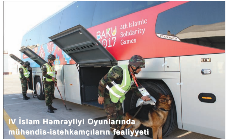
IV İslam Həmrəyliyi Oyunlarında mühəndis-istehkamçıların fəaliyyəti