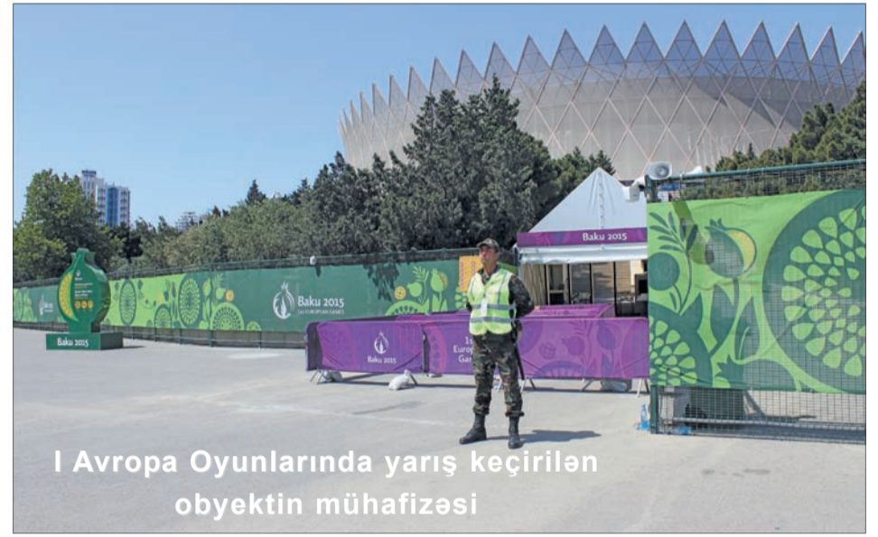
I Avropa Oyunlarında yarış keçirilən obyektin mühafizəsi