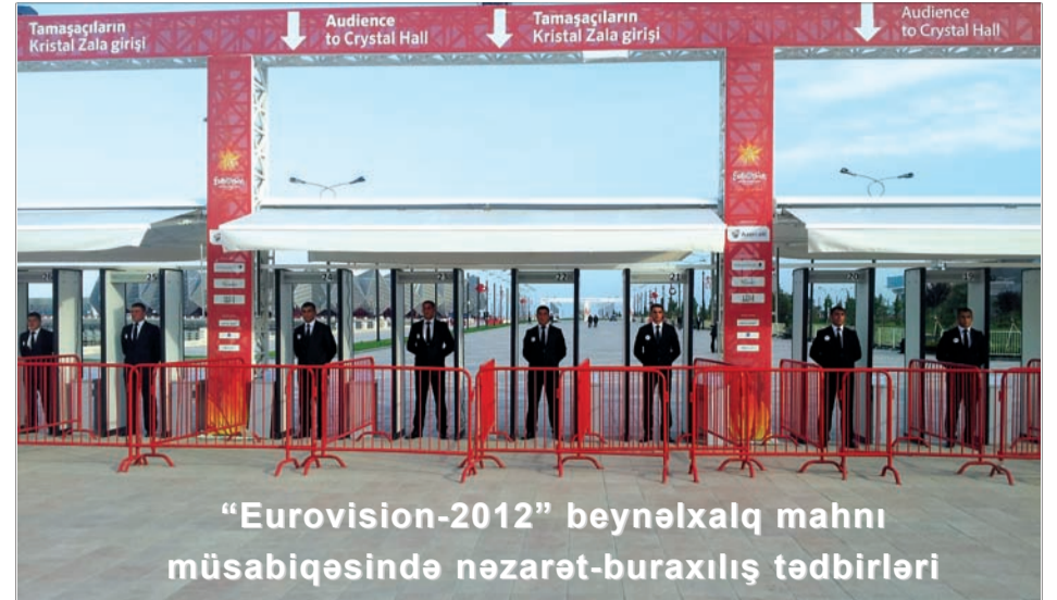
"Eurovision-2012" beynəlxalq mahnı müsabiqəsində nəzarət-buraxılış tədbirləri

Daxili İşlər Nazirliyinin Daxili Qoşunlarının yüksək hərbi hazırlığının rəhni Azərbaycan Respublikasının Prezidenti, Silahlı Qüvvələrin Ali Baş Komandanı İlham Əliyevin daimi diqqəti və böyük qayğısıdır. Daxili işlər orqanlarının, onun ayrılmaz hissəsi olan Daxili Qoşunların maddi-texniki təchizatının müasir standartlara çatdırılmasını, şəxsi heyətin sosial problemlərinin həllini, onların yaxşı yaşamasına əlverişli şəraitin yaradılmasını daim diqqət mərkəzində saxlayan Prezident İlham Əliyev hər il bu istiqamətdə çox mühüm addımlar atır.