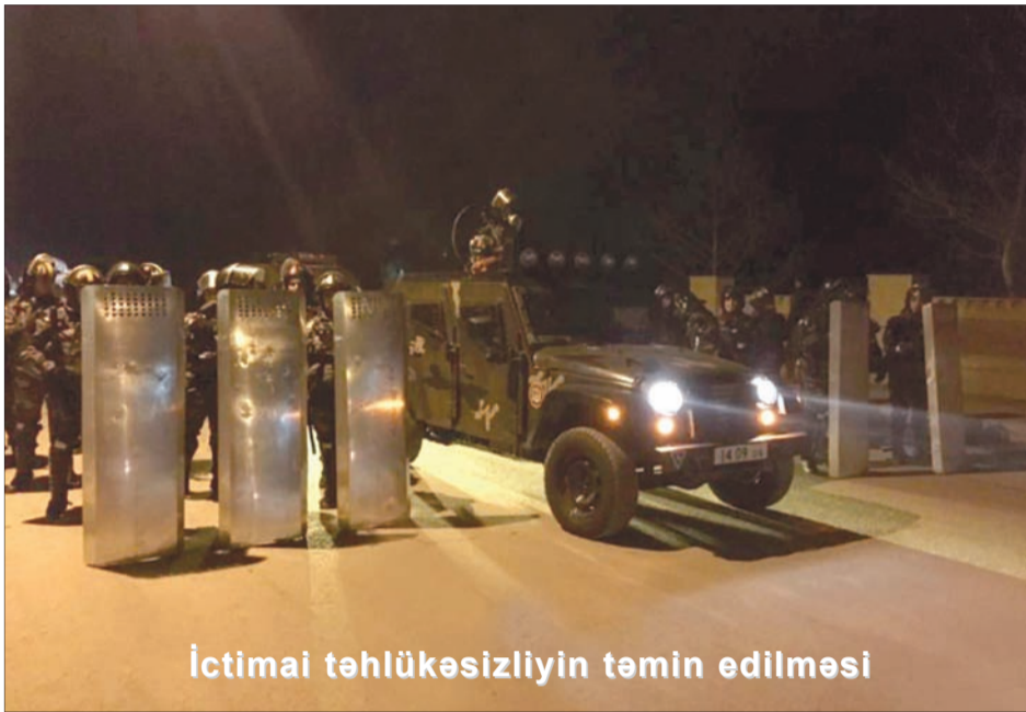
İctimai təhlükəsizliyin təmin edilməsi

2015-ci il mayın 19-da Bakı şəhərinin Binəqədi rayonunda yerləşən 16 mərtəbəli yaşayış binasında baş vermiş yanğın zamanı xilasetmə işlərində digər aidiyyəti qurumlarla yanaşı, Daxili Qoşunların da qüvvələri cəlb olunmuşdur.