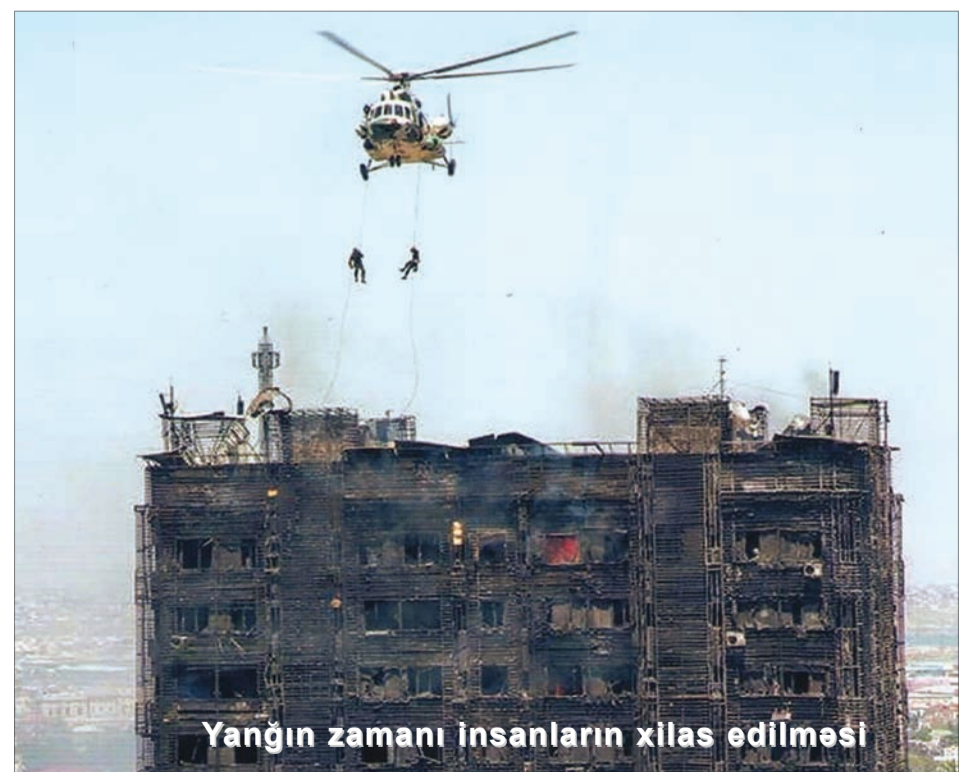
Yanğın zamanı insanların xilas edilməsi