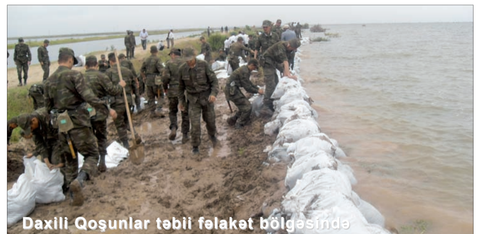
Daxili Qoşunlar təbii fəlakət bölgəsində