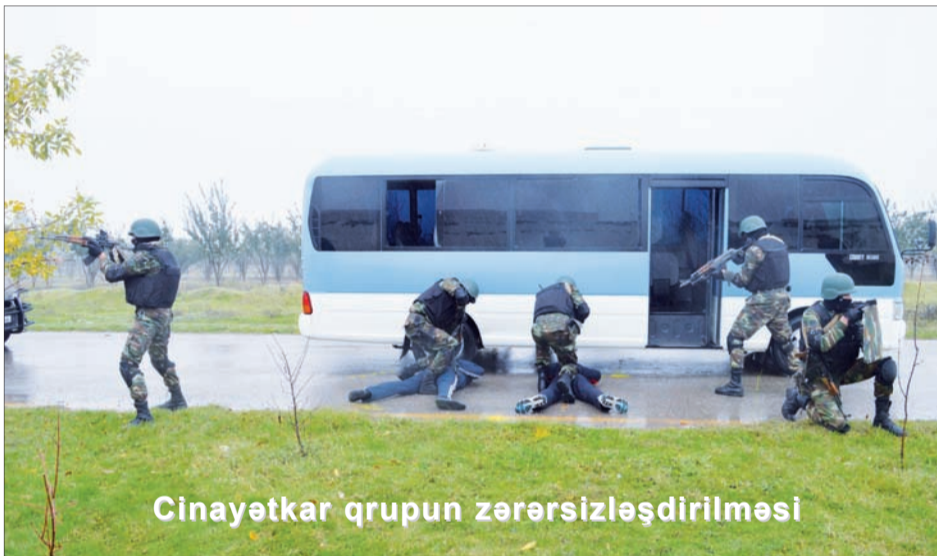
Cinayətkar qrupun zərərsizləşdirilməsi