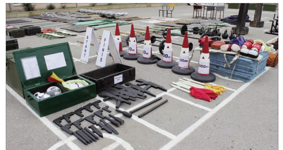
Kütləvi-idman işinə baxış üzrə:

XII yer - 17071 sayılı hərbi hissə XIII yer - 16076 sayılı hərbi hissə XIV yer - 25031 sayılı hərbi hissə