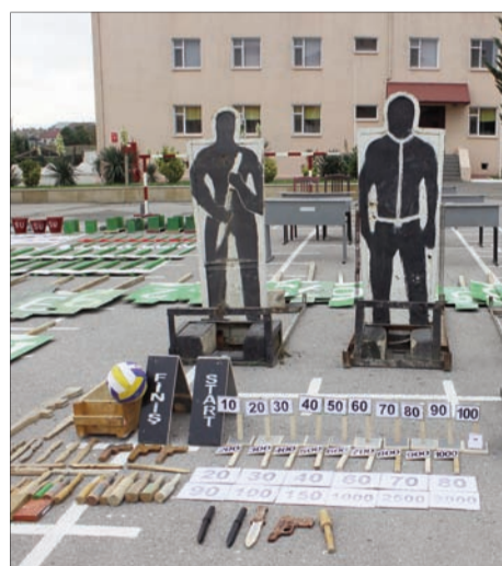
Maddi-texniki tədris bazasına baxış üzrə:

Hərbi hissələrdə keçirilən maddi-texniki tədris bazasına və kütləvi idman işinə baxış müsabiqəsinin nəticələrinə görə yerlər aşağıdakı kimi təyin olunub: