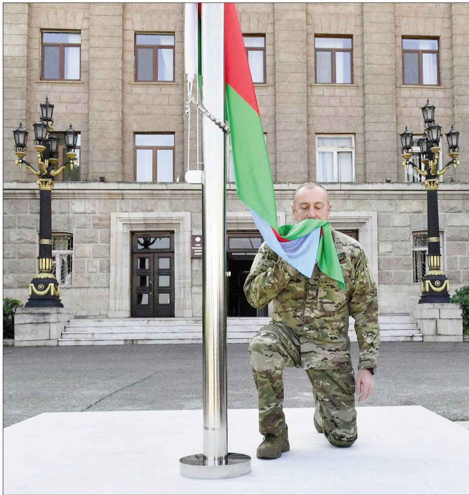
Bütöv Azərbaycan namini

20 illik qısa zaman diliminə əslin fəvriyyəti olan zəfərlər sığdıraraq Azərbaycan xalqını başıuca, qürurlu, bəxtəvər edən Müzəffər Ali Baş Komandan, Prezident İlham Əliyevə tükənməz minnətdarlıq duyuruq!