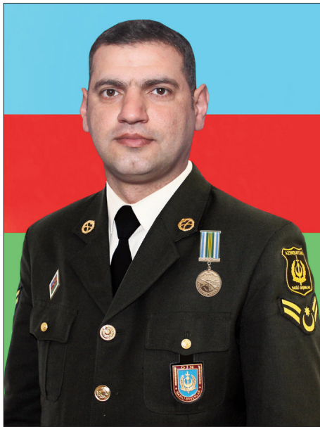
lüksəziyyətin qorunması ilə bağlı tapşırıqları məsuliyyətlə icra edib.

17072 sayılı hərbi hissənin xüsusi vasitələrinin təbii dəstəsinin xüsusi vasitələrinin təbii qrupunun meteomüşahidəçi-atıcısı, xüsusi vasitələrinin təbii qrupunun komandiri və yarımqrup komandiri vəzifələrinə təyin edilərək komandanlığın etimadını doğruldub. Xidmət dövründə "gizir" hərbi rütbəsinədək yüksəlib. Şəxsi işində heç vaxt intizam cəzası barədə qeyd olmayıb, nümunə